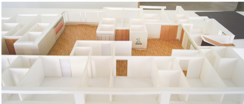
Vue d'un étage