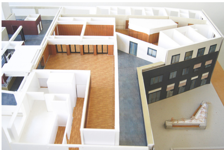
Vue de la future cafétéria avec terrasse