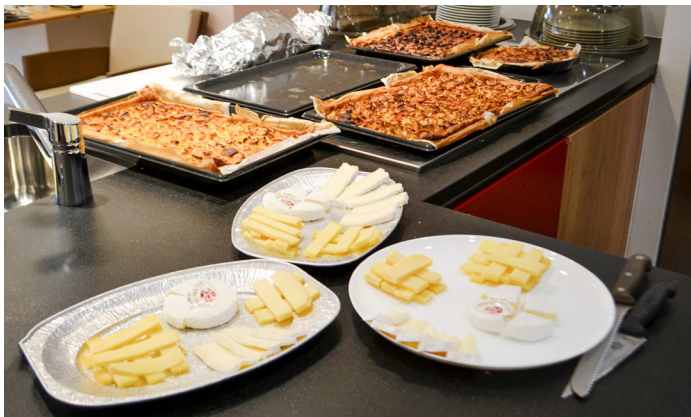
Les plateaux de fromages et divers gâteaux

Répartis en plusieurs groupes, les bénéficiaires en charge du salé ont ainsi lavé, pelé et coupé les 7 sortes de légumes qui composaient la soupe. Un travail bien récompensé par une soupe riche et succulente. Pendant ce temps, le groupe de bénéficiaires préposé au sucré a préparé de délicieux gâteaux pour un régiment affamé. Effectivement, lors de ce repas convivial, pas moins de 28 convives se sont régalés dans une bonne ambiance, mêlant coutumes et souvenirs.